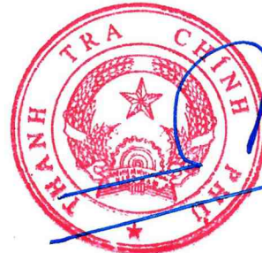
Dương Quốc Huy